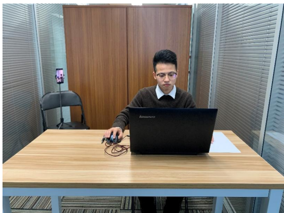
图一：电脑端正面视角

考生背靠白墙就坐。考试时，请对准系统提供的人像框，保持坐姿端正，面部、上半身在视频中清晰可见，防止出现“大头照”现象。（详见说明书中《智考通操作手册》《智考云在线考试规范》）