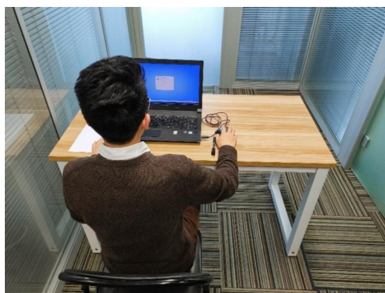
图二：电脑端背面视角